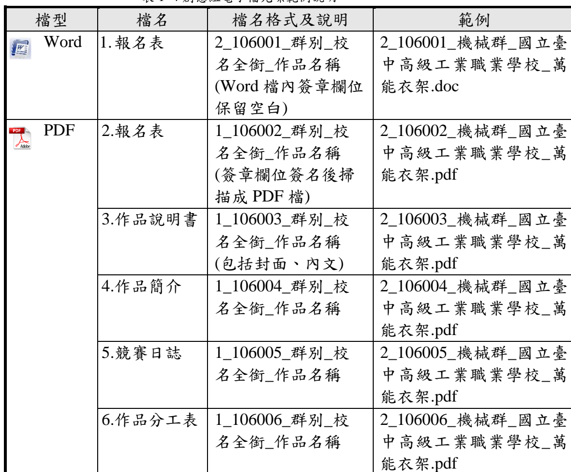
表 1-4 創意組電子檔光碟範例說明