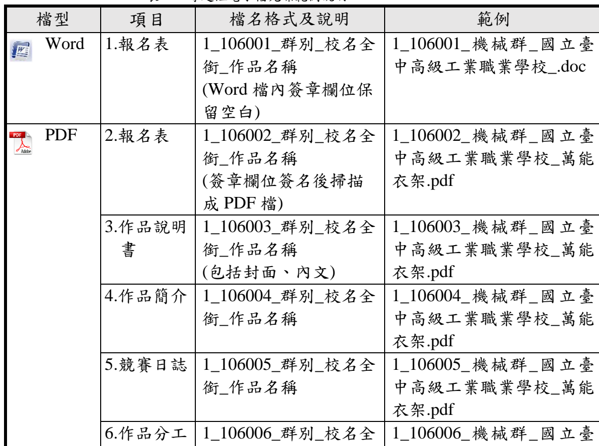
表 1-2 專題組電子檔光碟範例說明